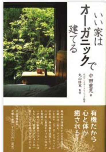
2013年5月20日 河田書房新社 田重克著「いい家はオーガニックで建てる」 「住いの血流」である水を浄化するには、 浄水器ハーレーIIを推薦されました。