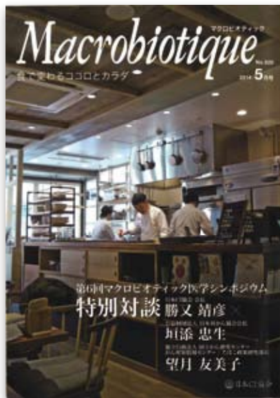
2014年5月号 日本CI協会発行 料理雑誌「マクロビオティック」 特集：安心とおいしいを 兼ね備えた浄水器ハーレーII